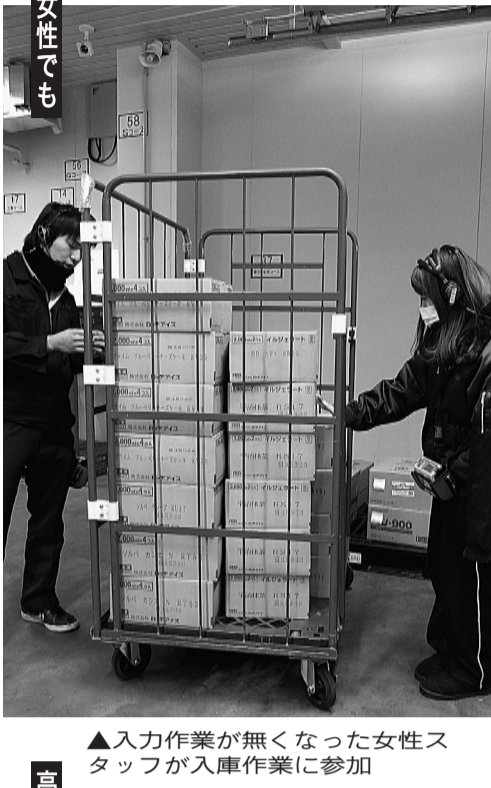
▲入力作業がなくなった女性スタッフが入庫作業に参加